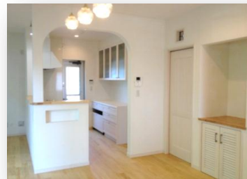
リビングから見た1階

インテリアのお仕事をされている奥さまの細やかな感性を感じる、やわらかで洗練されたお住まいです。図面上ではイメージしにくい、素材の質感や照明