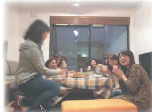
タイマーで撮影♪ 失敗2回目(笑)

翌日もモデルハウスはOPENだっ たので、少し早めに起床して熱々の コーヒーを入れて、皆でまった～り。 なんとも言えない幸せな時間を過ご しました～(^_^)楽しかった～。 OBさんも楽しんでいただけました か?私は次の開催が楽しみです(笑) 今度はクリスマスとか?楽しそう～