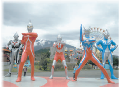
雲に隠れるウルトラマンの後ろの富士山

今年は晴天続きのGWでしたね。 tamiは家族3人と義母と一緒に、 御殿場～箱根へ行ってきました。 富士山のふもとの空気は涼やか で本当に気持ちがいいですね。 秩父宮記念公園で草花を楽しみ、 富士山2合目の遊園地「ぐりん ぱ」では肌寒くてコートが欲し い程でした。遊園地内にウルト ランパークがあるのですが、