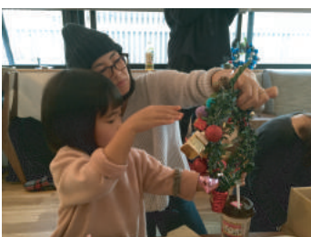
只今、家族会議中(笑)

家族で一つのリースを作るところは、付けたいアイテムも家族の承認を得てからでないと追加できないようで、気づくと皆さん家