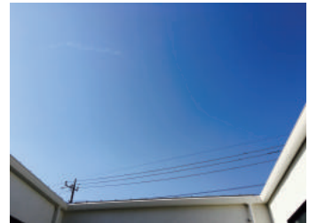
どの部屋からもこの眺め☆

⇒ むのが早く、やればやるほどスピードがアップしていました！一方、タイル貼りに奮闘する奥さま。タイルを一枚一枚壁にしっかりと接着するのに、なぜか体全体がぐねぐねと小刻みに動くのです。それも、気づくか気づかないか位の本当に少しだけ。思わず突っ込んでしまうような、とってもキュートな奥さまでした☆さて、そんなAさま夫妻が頑張って塗ったお家。家の中から見える空がビックリする位広い！中庭を囲むように作られた口の字の居室は、全ての部屋が明るくまるで家の中に居ることを忘れるような素敵なお家です。もう間もなく完成です！Aさま、待ち遠しいですねっ(^.^)♪