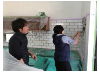
小刻みに動く姿が、可愛い奥さま(笑)

⇒ むのが早く、やればやるほどスピードがアップしていました！一方、タイル貼りに奮闘する奥さま。タイルを一枚一枚壁にしっかりと接着するのに、なぜか体全体がぐねぐねと小刻みに動くのです。それも、気づくか気づかないか位の本当に少しだけ。思わず突っ込んでしまうような、とってもキュートな奥さまでした☆さて、そんなAさま夫妻が頑張って塗ったお家。家の中から見える空がビックリする位広い！中庭を囲むように作られた口の字の居室は、全ての部屋が明るくまるで家の中に居ることを忘れるような素敵なお家です。もう間もなく完成です！Aさま、待ち遠しいですねっ(^.^)♪