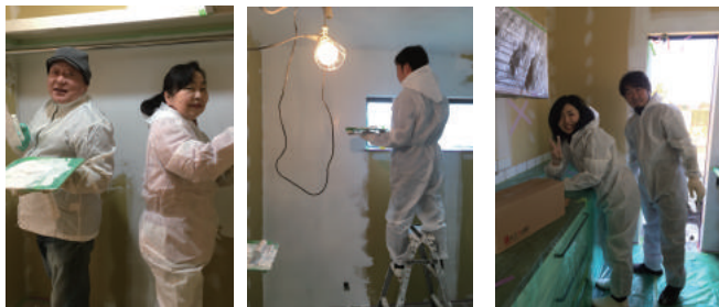
家族みんなで塗りました☆ 翌日はみんな揃って筋肉痛(笑)

吉川市に建築中の口の字型の平屋のAさま邸。お引渡しへ向けて最後の仕上げに内壁の壁塗りを行いました！二日間かけて行った壁塗りは、Aさんのお父さんやお母さん、弟さんもご参加。皆さん、初めての壁塗りでしたが、コツをつか