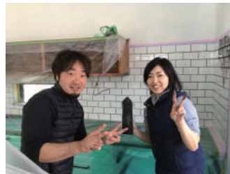
キッチンのタイル貼り！頑張るぞ～！