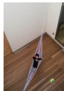
ハンモックは中庭にも♪